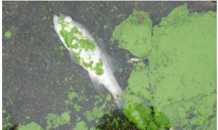
藻華現象可對野生生物造成危害。

降落在停車場和屋頂等硬質表面的雨水可能含有污染物，並將其帶入本地河流。受污染的逕流便稱為「雨洪」，它們會流經這些硬質表面，直接流入排水渠，導致土壤和植物沒有機會吸取雨水並過濾污染物。污染物可導致綠藻滋生，對人類、野生生物及寵物造成危害。而狗隻和野生生物糞便中的細菌，亦會導致水體變得不宜游泳及拾貝。