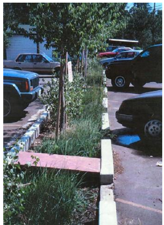
Solução de jardim pluvial para escoamento de estacionamento.