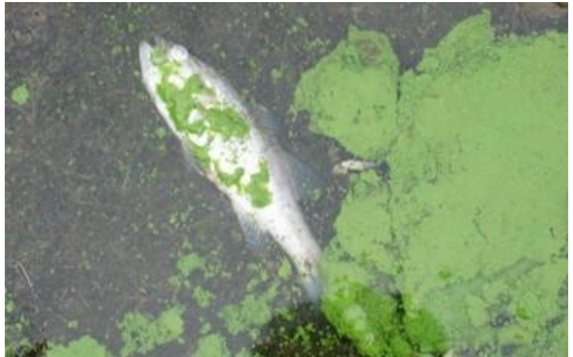
A proliferação de algas pode prejudicar a vida selvagem.

A água da chuva que cai em superfícies rígidas, como estacionamentos e telhados, pode acumular poluentes que são então transportados para os rios locais. Esse escoamento poluído, conhecido como “águas pluviais”, flui através dessas superfícies rígidas diretamente para os esgotos pluviais, pois não há oportunidade para o solo e as plantas absorverem a água da chuva e filtrarem os poluentes. Esses poluentes podem levar ao crescimento de algas verdes que podem prejudicar pessoas, animais selvagens e animais de estimação. E as bactérias dos dejetos dos cães e da vida selvagem podem tornar as águas impróprias para natação e pesca de marisco.