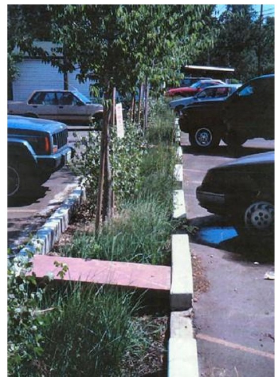
Решение проблемы отвода воды с автостоянки с помощью дождевых садов.